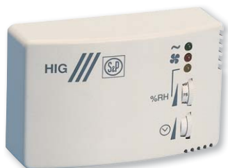
LxAxH (mm): 130 x 43 x 82