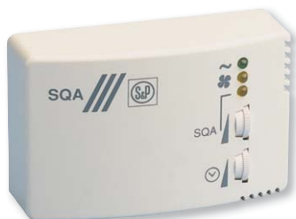
LxAxH (mm): 130 x 43 x 82