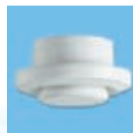
BEIP 100 Aanzuigrooster