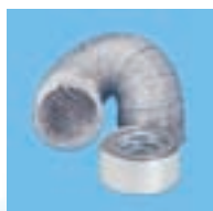
GSA-100 Aluminium flexibel (4m) + alu plakband