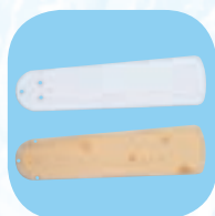
Mod. HTL-130 4F Omkeerbare vleugel Wit/lichtbruin