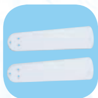
Mod. HTD-130 B Witte vleugel