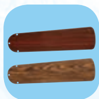
Mod. HTD-130 MR Omkeerbare vleugel Donker bruin Licht bruin