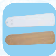
Mod. HTL-130 1G Omkeerbare vleugel Wit/donkerbruin