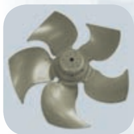
Le dessin spécial de l'hélice permet un grand déplacement d'air dans les industries