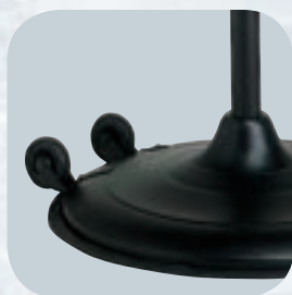
Roulettes pour faciliter le transport