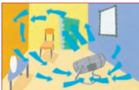
Ventilation d'habitations et de locaux