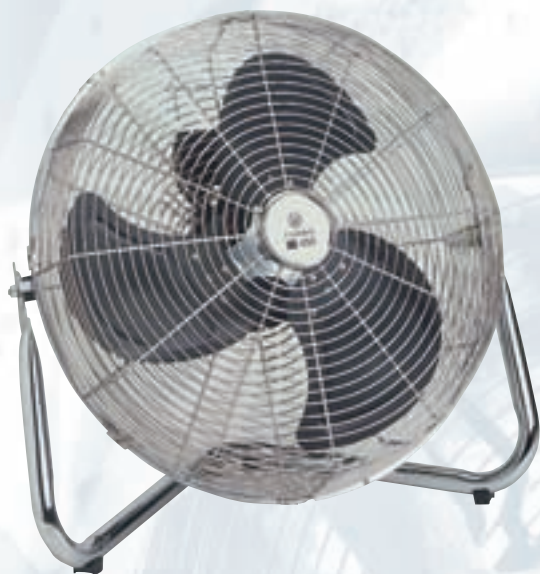
Turbo 351N et 451N

Ventilateurs portables spécialement conçus pour déplacer de grands volumes d'air, avec traitement anti-corrosion au moyen d'une peinture époxy, hélice en métal équilibrée dynamiquement et moteur monophasé 230V-50Hz avec protection thermique incorporée .