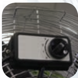
Variateur à 3 vitesses

Turbo 351N et 451N: conçus pour usages domestiques et commerciaux