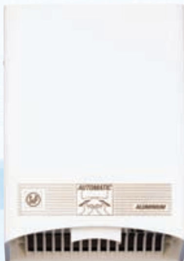
SL-2002 AUTOMATIC ALUMINIUM

Couleur Blanche (SL-2002 AUTOMATIC) ou Gris (SL-2002 A SILVER).