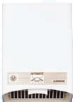
SL-2002 AUTOMATIC ALUMINIUM