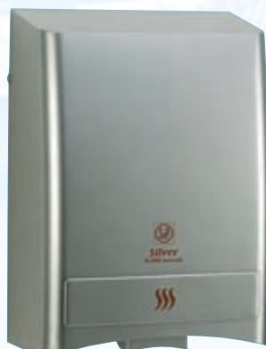
SL-2002 A SILVER