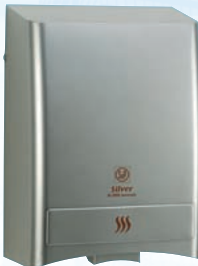
SL-2002 A SILVER

Mise en marche automatiquement par cellule photoélectrique.